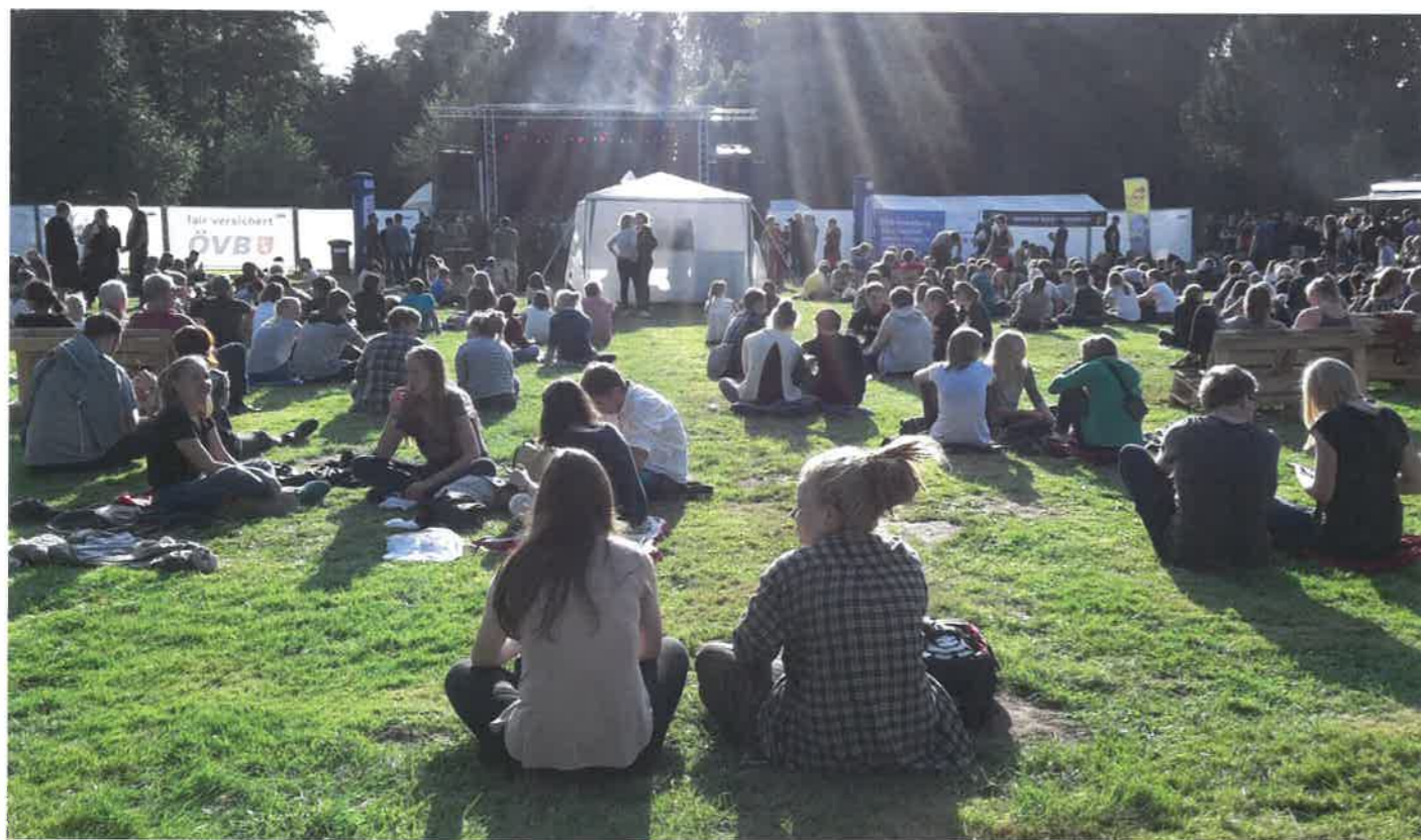
Festival-Feeling: Nachmittags wird gehillt und abends gerockt. Beim Festival „Horn to be wild“ im Rhododendronpark ist für jeden Geschmack etwas dabei. Bereits zum dritten Mal findet das Event, das komplett vom Jugendlichen auf die Beine gestellt wird, statt.

Es wird am 5. August also an nichts fehlen und wir können uns auf einen tollen Festivaltag freuen im grünen Herzen Bremens.