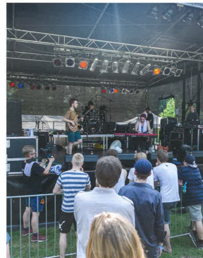
Junge Bremer Bands begeistern beim Festival mit frischen Sounds

Informationen zu den Bands und Tickets: www.horntobewild-festival.de